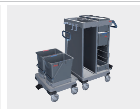
Origo2 CX (Porta-saco 70L)

Origo2 C-B Carro funcional com satélite para agilizar o processo de limpeza. - 1x conjunto de painéis com calhas - 3x baldes de 5L com tampa - 1x contentor com tampa - 1 bandeja - 2x conjuntos adaptadores 4 cliques - 1x base com 2 baldes de 25L - 1x Pega para manobrar B