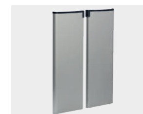
Conjunto de Portas