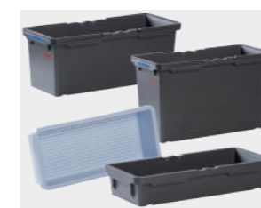
Contentor Mopas, gaveta, bandeja e bandeja perfurada

Acessórios Para personalizar a oferta existe uma vasta gama de componentes.