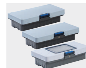
Tampas Superiores Basic, Compartimento e Tablet