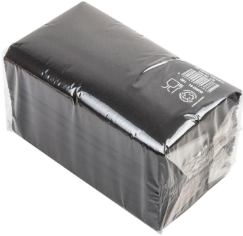
Imagem do pacote