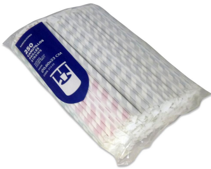
Imagem do pacote

Regulamento (CE) nº 2023/2006 da Comissão Europeia de 22 de dezembro de 2006, sobre boas práticas de fabricação de materiais e objetos destinados a entrar em contato com alimentos.