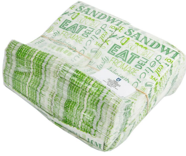
Imagem do pacote