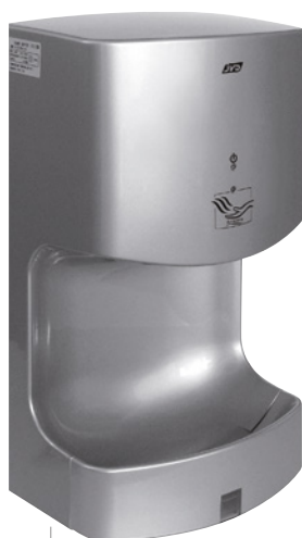
8 11 684