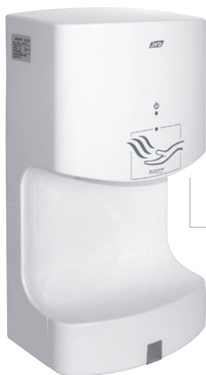
8 11 707