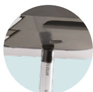
EVACUACIÓN DIRECTA CONEXIÓN AL DESAGÜE POSIBLE GRACIAS AL KIT EVACUADOR INCLUIDO