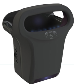
REF 8 11 1376 Exp'air automático negro epoxi UL 1 : 1