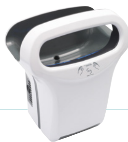
REF 8 11 791 Exp'air automático aluminio blanco epoxi UL 1 : 1

+ REF 5 90 2014 Filtro de cobre Bactericida UL 1 : 1