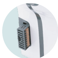
HIGIÉNICO FILTRO DE COBRE BACTERICIDA Y DEPÓSITO DE AGUA INTEGRADOS, TRATAMIENTO ANTIBACTERIANO DE LAS SUPERFICIES

+ REF 5 90 2014 Filtro de cobre Bactericida UL 1 : 1