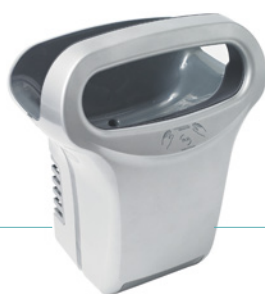
REF 8 11 822 Exp'air automático aluminio gris epoxi UL 1 : 1