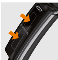
SISTEMA DE ENCENDIDO PATENTADO