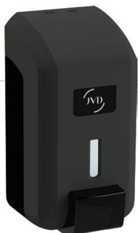
REF 8 44 1378 Cleanline espuma carcasa negra mate UL': 24 REF 8 44 1379 Cleanline gel carcasa negra mate UL': 24