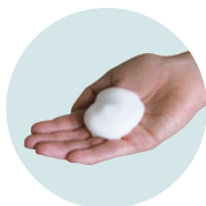
ESPUMA LA ESPUMA PERMITE DIVIDIR HASTA 8 VECES EL CONSUMO DE JABÓN