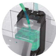
PRÁCTICO FÁCIL DE RECARGAR Y LIMPIAR GRACIAS A SU DEPÓSITO AMOVIBLE