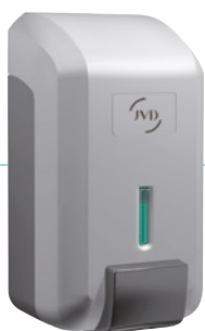
REF 8 44 732 Cleanline espuma carcasa gris UL': 24 REF 8 44 731 Cleanline gel carcasa gris UL': 24