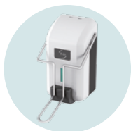
HIGIÉNICO LA VERSIÓN CON PALETA EVITA EL CONTACTO CON LAS MANOS (REF 8 44 972)