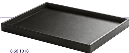
8 66 1018 Bandeja Charme UL 1 : 12