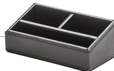
8 66 1020 Portabolsitas Charme UL 1 : 54