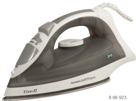
8 66 923