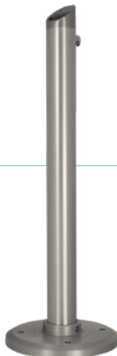
REF 8 99 1001 Tótem tubular inox espejo 4,5 L sobre pie UL 1 : 1