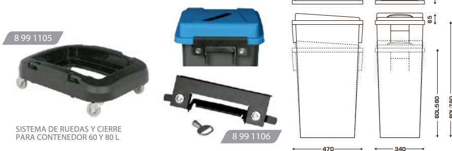
SISTEMA DE RUEDAS Y CIERRE PARA CONTENEDOR 60 Y 80 L