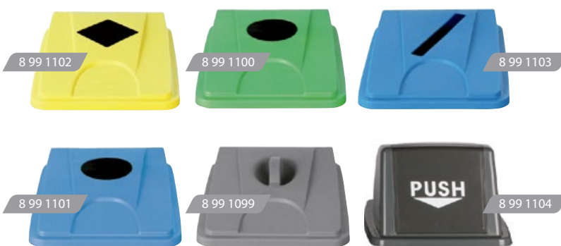
TIPOS DE TAPAS DISPONIBLES PARA EL CONTENEDOR TRI SELECTIVO 60 Y 80 L.