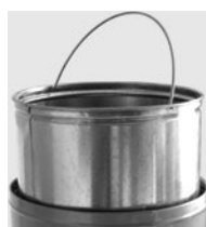
CUBO INTERIOR GALVANIZADO CON ASA INCLUIDA