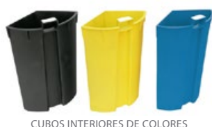
CUBOS INTERIORES DE COLORES