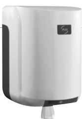
REF 8 99 605 Cleanline boquilla central maxi carcasa blanca UL 1 : 6