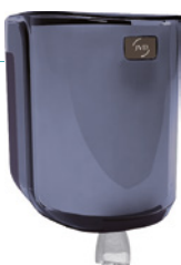
REF 8 99 737 Cleanline boquilla central maxi carcasa transparente fumé UL 1 : 6