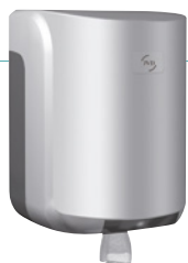
REF 8 99 736 Cleanline Boquilla central maxi carcasa gris metalizada UL 1 : 6