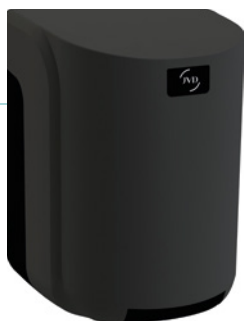
REF 8 99 1383 Cleanline Boquilla central maxi negro UL 1 : 6